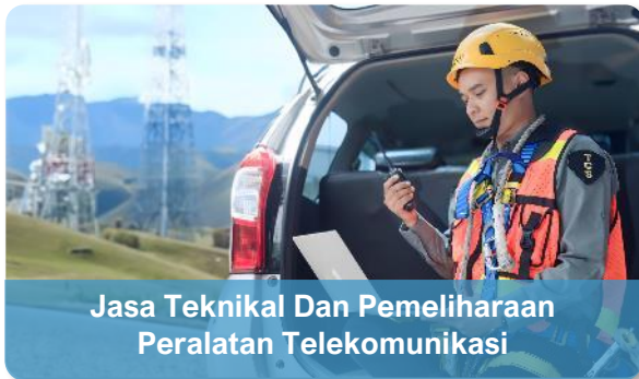
Jasa Teknikal Dan Pemeliharaan Peralatan Telekomunikasi

Site Maintenance, Roll Out, Network Maintenance, Building Maintenance, Electrical Services, IT Helpdesk, dll.