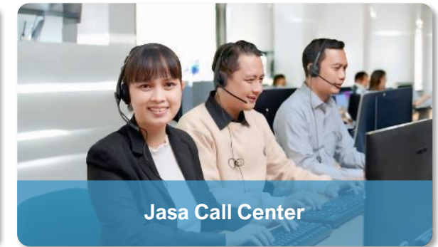
Jasa Call Center

Customer Service, Call Center ( Inbound, Outbound, QA, Social Media ), dll.