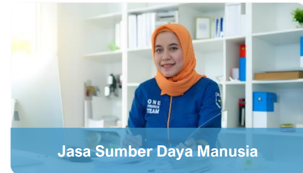
Jasa Sumber Daya Manusia

Managerial Level, Experties, Expatriate.