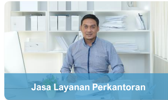
Jasa Layanan Perkantoran

Marketing, Sales, Canvasser, Receptionist, Cashier, Administrator, Cleaning Service, Driver, Ekspedition, dll.